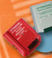
→ Controllo varchi