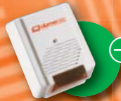
→ Centrali protezione esterna