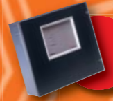
→ Gruppi di alimentazione